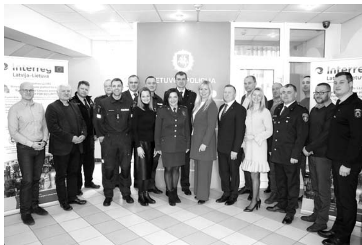
Paskutinis Projekto iniciatyvinės grupės susitikimas Utenos aps. VPK.

vyko Utenos aps. VPK, visi aštuoni projekto partneriai sutarė, kad projekto tikslas buvo ambicingas, novatoriškas ir keliantis didžiulius iššūkius kiekvienam.